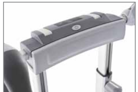
SoftTouch Komfortpolster zum unterstützenden Ablegen der Bedieneinheit auf den Oberschenkel