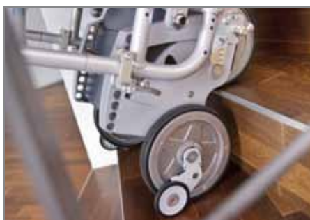
Patentierter Steigmechanismus: treppenschonend Stufe um Stufe hinauf- oder hinabsteigen

Das scalamobil passt an die meisten handelsüblichen Rollstuhlmodelle. Es genügt, eine spezielle Halterung an den eigenen Rollstuhl zu montieren. An dieser wird das scalamobil mit wenigen Handgriffen befestigt. Der Vorteil: Der Rollstuhlfahrer muss nicht umsitzen. Zum Treppensteigen werden die großen Rollstuhlräder dann kurzzeitig abgenommen oder mit einer optional erhältlichen Zusatzhalterung gleich mittransportiert.