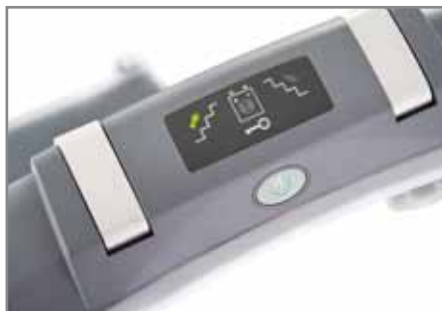
Mit dem übersichtlichen Display immer alle wichtigen Funktionen im Überblick behalten