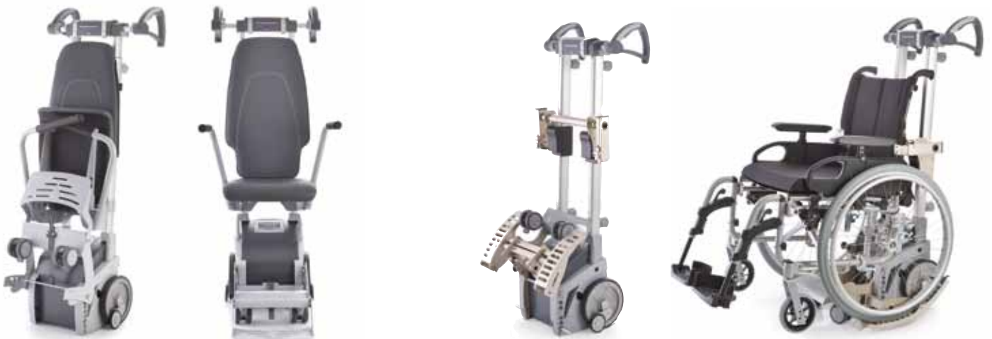
scalacombi mit integrierter Sitzeinheit (statt Rollstuhl): auch für besonders enge Treppenhäuser geeignet

Für den Transport unterschiedlicher Rollstühle eignet sich der Universaladapter scalaport. Mit diesem Zubehör kann fast jeder Rollstuhl mit nur wenigen Handgriffen ohne spezielle Halterung an das scalamobil angedockt werden. Besonders für Fahrdienste und öffentliche Gebäude ist dies ein großer Vorteil.