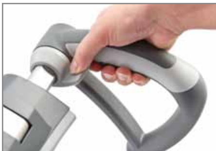
Rutschsichere ErgoBalance Griffe mit handlich geformtem Bedienschalter

Das scalamobil verfügt über patentierte Sicherheitssensoren und lässt sich bei Bedarf individuell auf die Gegebenheiten der Treppe programmieren. Die Sensoren unterstützen auf Wunsch die Bedienperson und ermöglichen einen noch sichereren und vor allem einzigartig sanften Steigvorgang. Dies ist nicht nur für Rollstuhlfahrer mit Rückenproblemen besonders vorteilhaft.