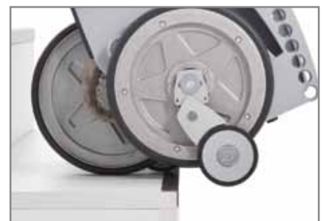
Vier automatische Sicherheitsbremsen stoppen das scalamobil zuverlässig vor jeder Stufenkante