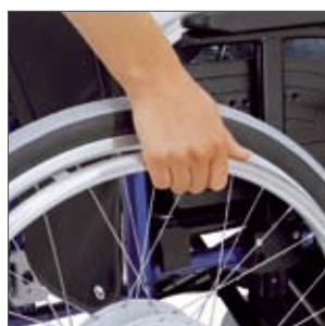
Per Hand anschieben oder elektrisch fahren: ganz wie Sie wollen!

Sie bleiben flexibel – zwei Rollstühle in einem!