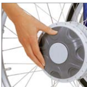
Antriebsräder einfach aus- oder einkuppeln